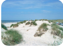
Der See vorm Haus

... erwarten Dich, wenn Du mit uns in Dänemark am Start bist. Direkt an der Nordsee liegt unser Haus. 50 Meter bis zum Strand - da sind dir alle Möglichkeiten offen. Sehr coole Leute und lebensnahe Inputs von erfahrenen Leitern machen diese Freizeit zu etwas Besonderem. Aber nicht nur das: die markante Nordseelandschaft, sonnige Tage und die Gezeiten machen das Programm rund. Natürlich alles nicht alleine. Viele super Leute, die, wie Du, Entspannung suchen und nahrhafte Inputs von und über Gott. Mit dem gesunden Abstand von Zuhause und allen Ansprüchen der Schule oder Arbeit sollst Du Zeit bekommen, im doppelten Sinne aufzutanken: Neue Kraft schöpfen und den Glauben festigen. Dazu Fun, Action und Herausforderungen. Herz - was willst Du mehr?